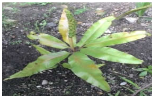
Gambar 1. Tumbuhan paku tunjuk langit ( Helminthostachys zeylanica ).

paru-paru. Tumbuhan ini mengandung saponin, flavonoid dan fenolik (Fitrya dan Anwar, 2009).